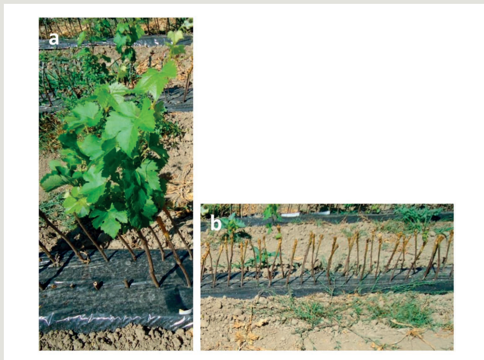
Figura 2 – Aspecto de plantas resultantes de uma combinação casta/porta-enxerto mais compatível (a) e menos compatível (b), na fase de enraizamento

O material vegetal certificado foi adquirido a um viveirista francês ou fornecido pelos Viveiros PLANSEL, tendo sido realizado neste último todo o ciclo de enxertia. No fi-