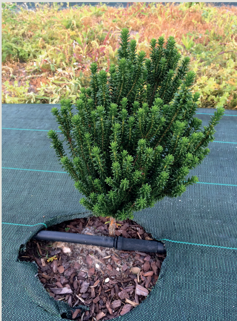
Figura 5 - Aspeto geral de uma planta de camarinha em plantação comercial um ano após plantação

Todos estes trabalhos de investigação serão apresentados no V Colóquio Nacional da Produção de Pequenos Frutos que se irá realizar nos próximos dias 14 e 15 de outubro no Instituto Nacional de Investigação Agrária e Veterinária, em Oeiras. ☺