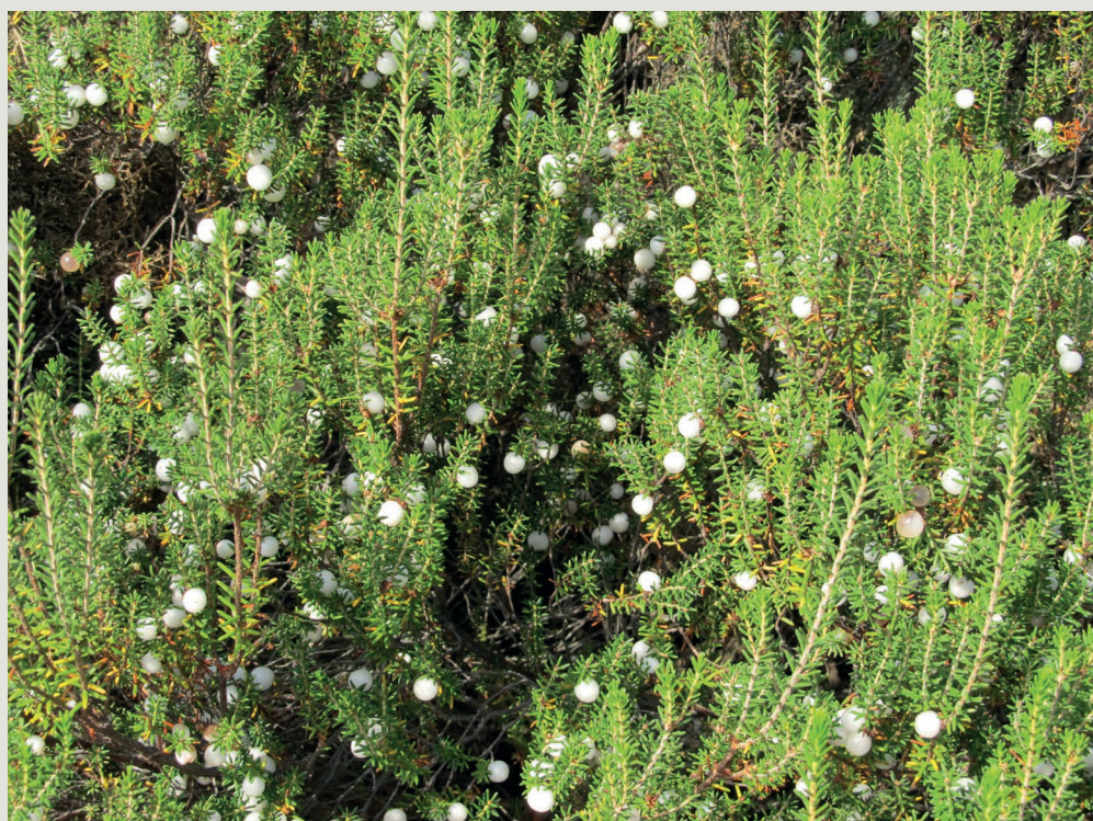
Figura 1 - Camarinha no seu habitat natural em plena frutificação

Num estudo recente sobre Fenologia - vegetativa e reprodutiva efetuou-se uma caracterização fenológica em que se descreve e esquematiza o desenvolvimento das principais fases da fenologia da espécie Corema album . Verificou-se que o crescimento vegetativo das plantas masculinas e femininas é similar, com diferenças temporais, observando-se 3 surtos de crescimento em ambos os géneros. A floração masculina é mais distribuída ao longo do tempo e apresenta um maior número de inflorescências e flores quando comparada com a floração feminina (Figura 2). Embora os arbustos masculinos iniciem primeiro a floração, o pico da floração é síncrona, pois a floração feminina é menos morosa. O fruto apresenta inicialmente uma