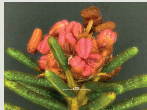
Figura 2 - Pormenor da floração de uma planta masculina de C. album

Tem havido um crescente interesse de estabelecer esta espécie como cultura, mas a informação sobre o seu sistema de reprodução é escasso, o que é essencial para a sua gestão sustentável e conservação. No sentido de aprofundar o conhecimento da morfologia e ontogenia floral realizaram-se observações e colheitas de material vegetal em plantas masculinas e femininas, em condições naturais, para descrever a morfologia das flores e correspondência entre a fenologia floral e a sua ontogenia. A comparação e integração dos resultados da morfologia e ontogenia da