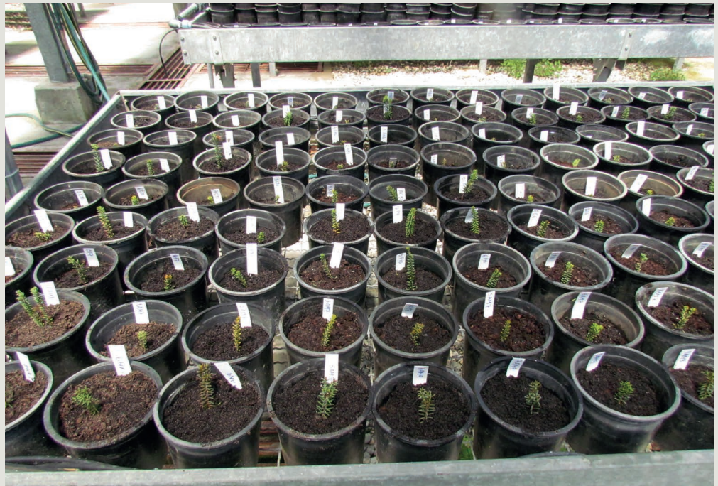
Figura 4 - Plantas recém-enraizadas de C. album e mantidas em estufa até pleno enraizamento

em qualquer estágio de desenvolvimento do ciclo de vida da planta.