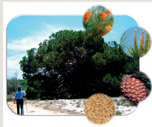
Figura 1 – Pinheiro manso ( Pinus pinea L.)