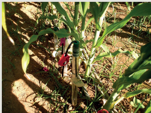
Figura 2 – Sistema de cápsulas porosas para recolha da solução do solo a diferentes profundidades

Os resultados obtidos indicam que o efeito da qualidade da água de rega no solo e nas culturas depende das propriedades do solo, mas também do próprio regime de chuvas. O primeiro determina a capacidade do solo para reter sais. A chuva é o principal veícu-