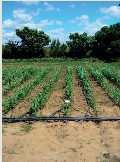
Figura 1 – Campo experimental com sistema de rega gota a gota para aplicação das soluções salinas com diferentes concentrações

As causas mais comuns de salinização induzida pelo homem são o uso de solos impróprios ou mal adaptados para a prática do regadio (com baixa permeabilidade e sem