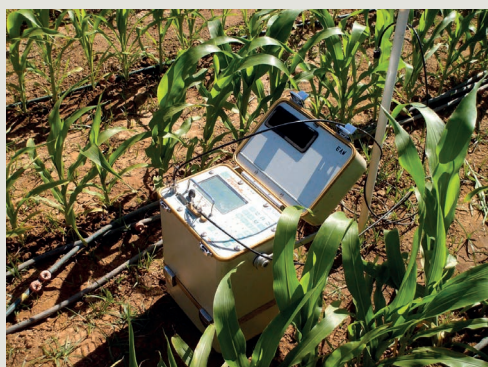
Figura 3 – Equipamento para medição do teor de água no solo a diferentes profundidades