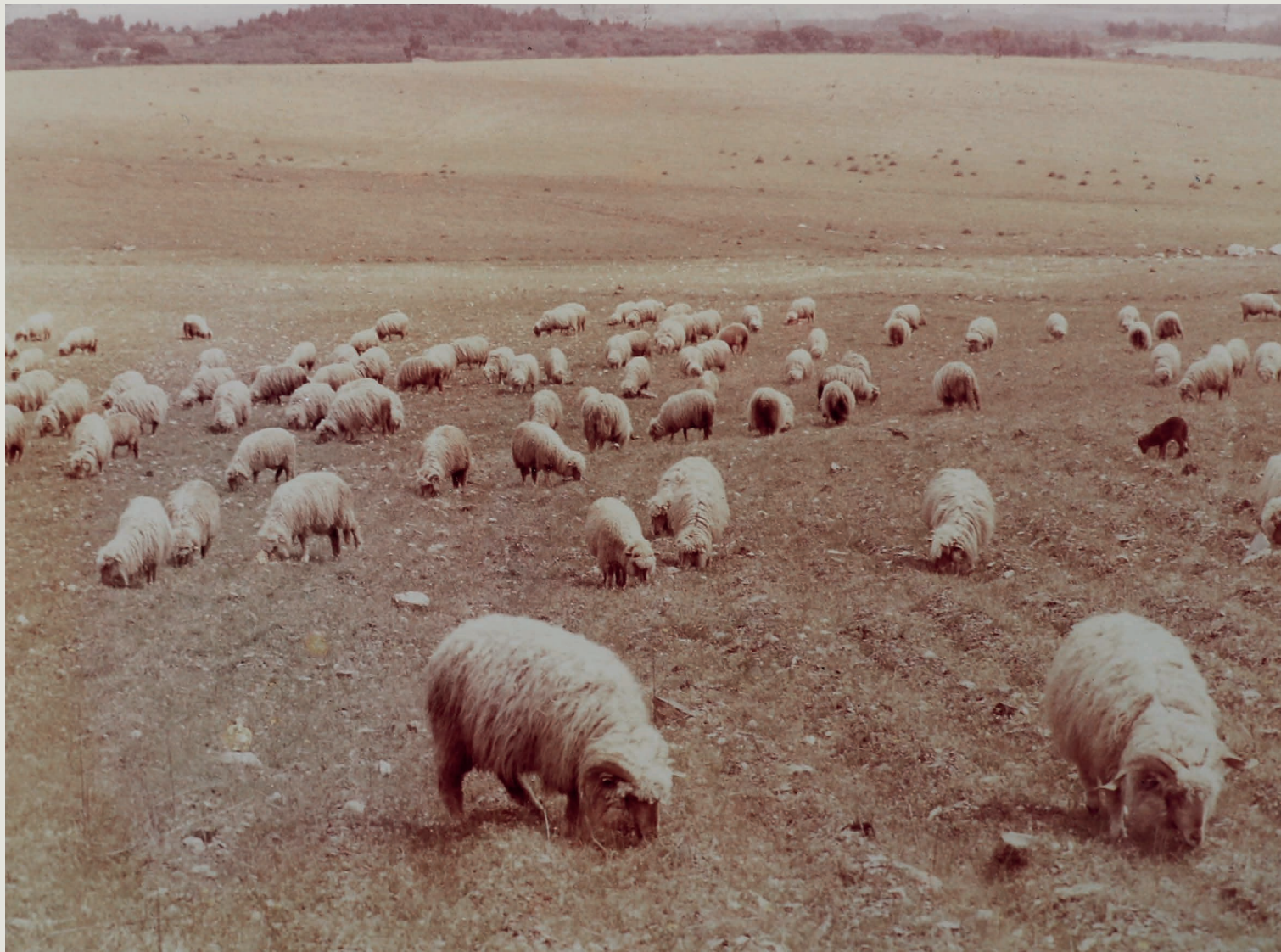
Figura 2 – Ovelhas da raça Churra do Campo em pastoreio nos campos da Beira Baixa

tem efeitos positivos na produção de MS em pastagens de zonas temperadas, mas com redução da digestibilidade e da concentração de proteína das pratenses, o que conduz a um decréscimo dos ganhos de peso dos animais em pastoreio que, porém, poderão ser atenuados com um adequado manejo de pastoreio e com a introdução de leguminosas, enriquecendo a composição florística das pastagens.